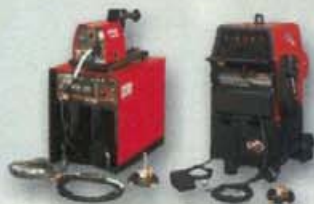
Soldadoras Para Proceso Especial

Monofásicas Trifásicas Con motor a gasolina