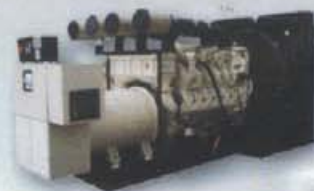
Planta de Luz

Desde 3 KW hasta 200 KW. Con motor a Gasolina y a Diesel.